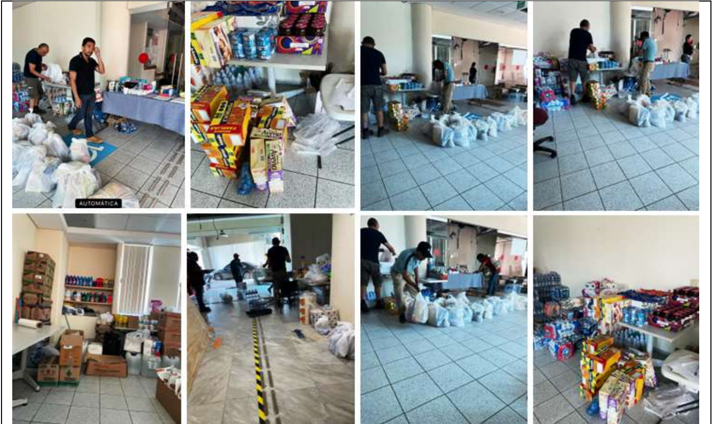
PRIMERAS AYUDAS DE VIVERES ENVIADAS

Mientras tanto el Sindicato de Trabajadores del Poder Judicial ha apoyado y gestionado las ayudas necesarias para que los trabajadores de Acapulco puedan realizar el rescate de sus fondos de retiro FORI y SEGSEI, así como que se les consiguiera el regreso a sus labores hasta el 15 de diciembre en virtud de no haber condiciones para el retorno de los trabajadores, así como la entrega de despensas que con los apoyos de los Líderes Seccionales y de las cuotas sindicales.