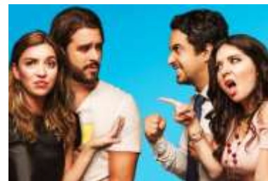
Tú eres Godínez → Lo siento, no lo soy

Esta polémica etiqueta que, sobre todo en redes sociales, suele acompañarse de burlas y comentarios ofensivos o discriminatorios, que incluyen en esta definición a quienes están obligados a soportar malos tratos en su empleo, porque no pueden encontrar uno mejor o porque se ajusta a la herencia familiar.