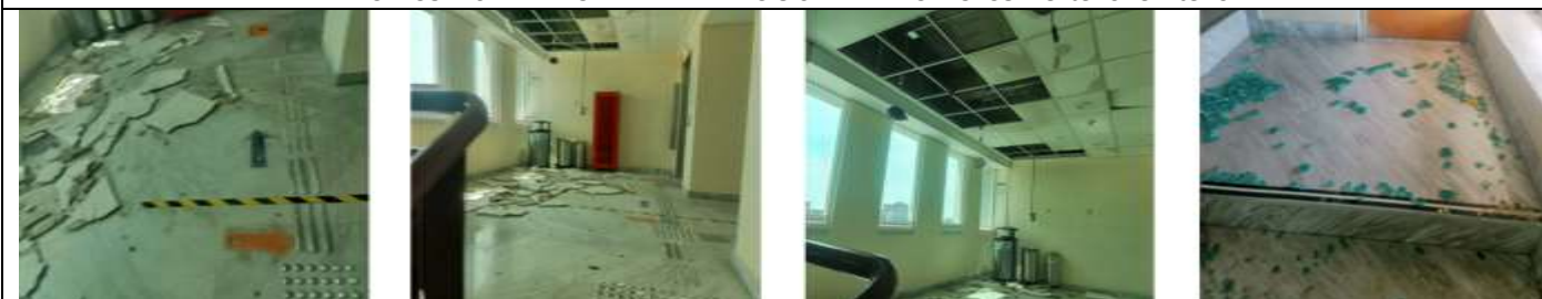
TRIBUNAL LABORAL FEDERAL DE ASUNTOS INDIVIDUALES DE ACAPULCO